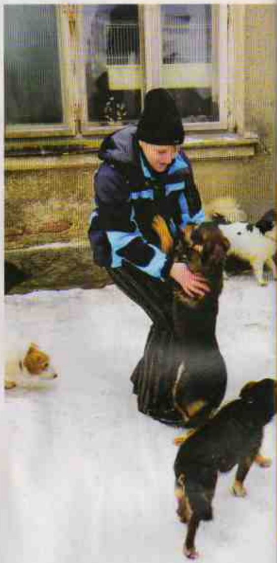
Venkovní výběh pro celou smečku